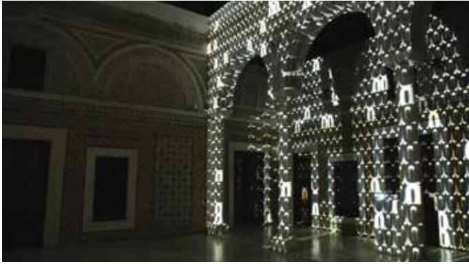
Abb.: »Zero« von Hartung + Trenz.