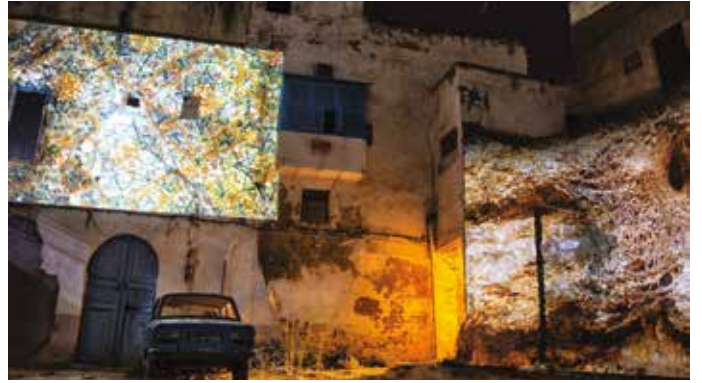
Abb.: »Biocenosys« von Tom Groll und Kuno Seltmann.