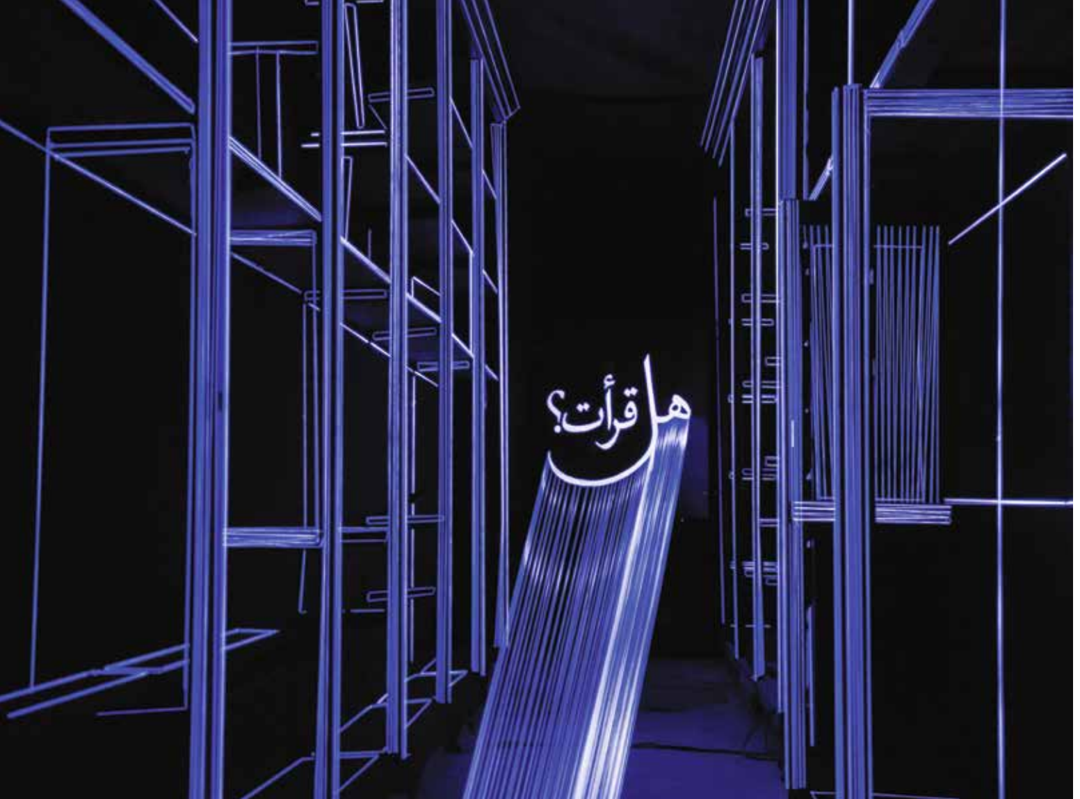
Abb.: »Vide-mémoire« von Houda Ghorbel + Wadi Mhiri.